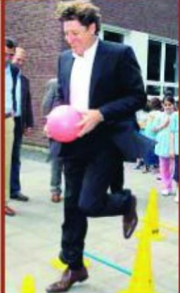
Toni Schumacher macht es vor. Seine Kinder treiben viel Sport und bekommen nur Biokost: „Fast-Food ist bei uns tabu!“

Viele Sponsoren sind bereits beteiligt. Managerikone und KIS-Beirat Reiner Calmund appelliert an die Wirtschaft: „Wir leben in einer Leistungsgesell-