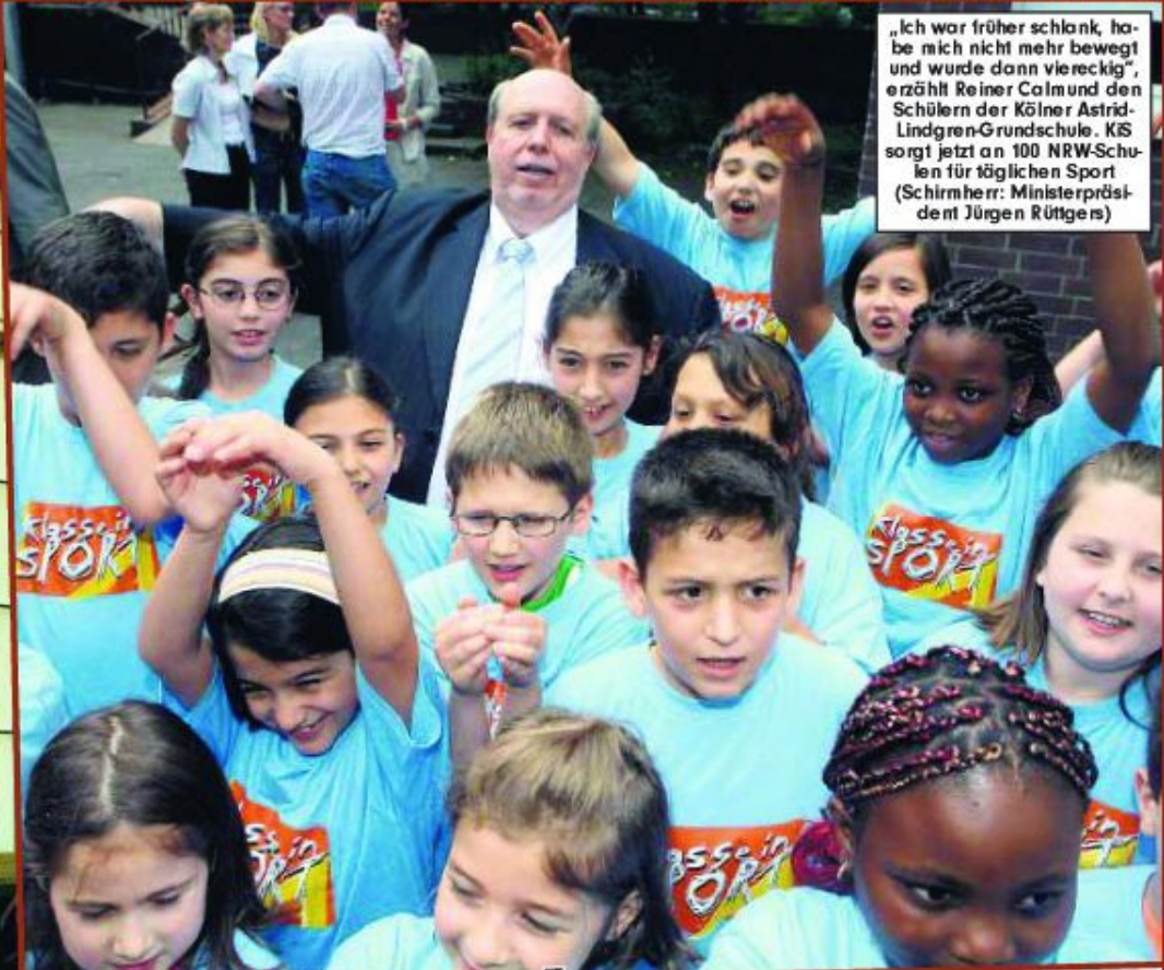
„Ich war früher schlank, habe mich nicht mehr bewegt und wurde dann vierckig“, erzählt Reiner Calmund den Schülern der Kölner Astrid-Lindgren-Grundschule. KIS sorgt jetzt an 100 NRW-Schulen für täglichen Sport (Schirmherr: Ministerpräsident Jürgen Rüttgers)